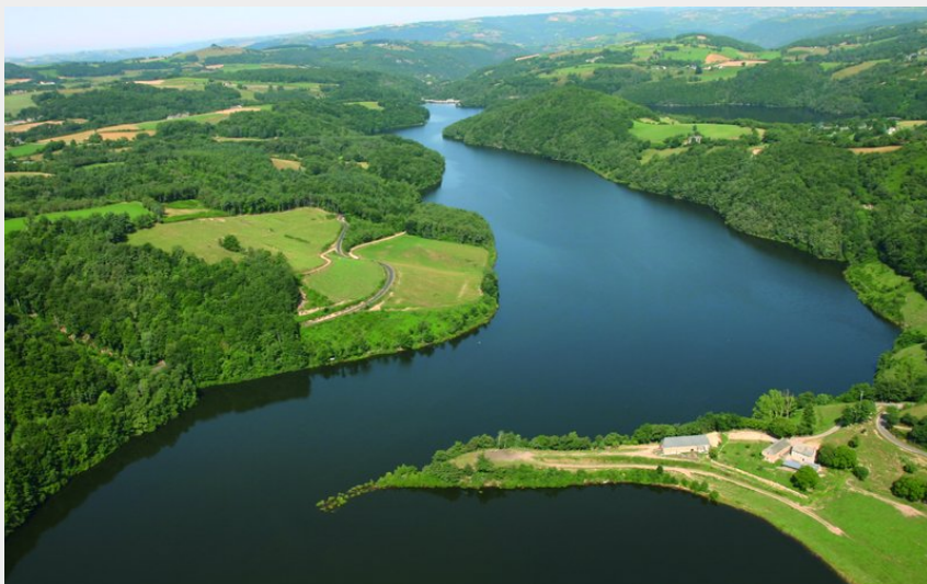
Vue aérienne lac de Maury (R.Coudert)