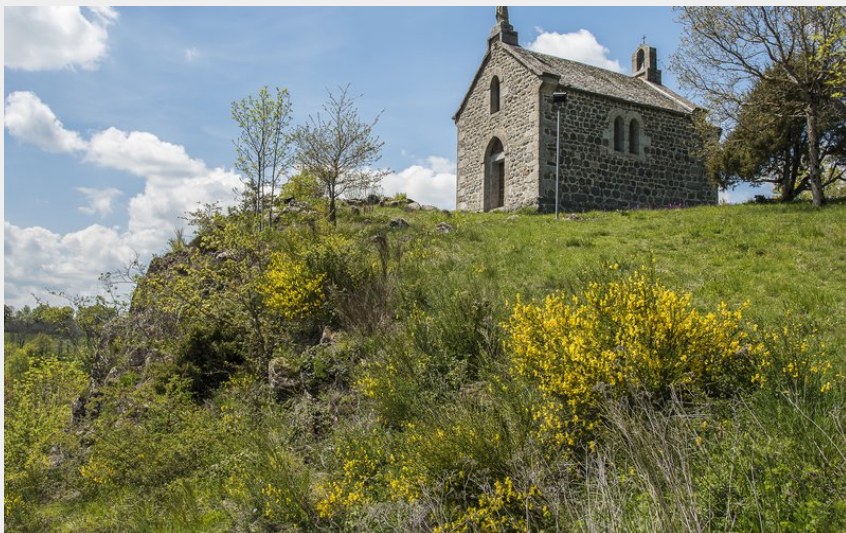
La chapelle du Roc