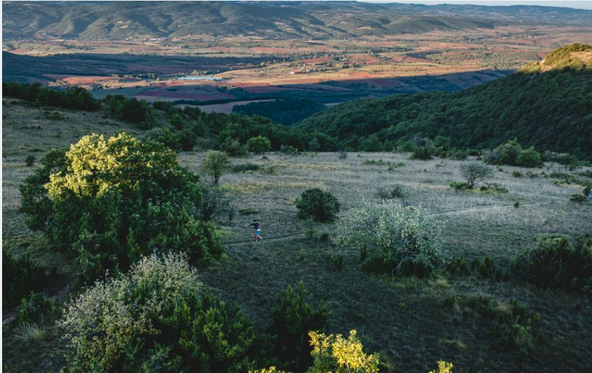
Panorama depuis le plateau de la Loubière (Virginie Govignon)