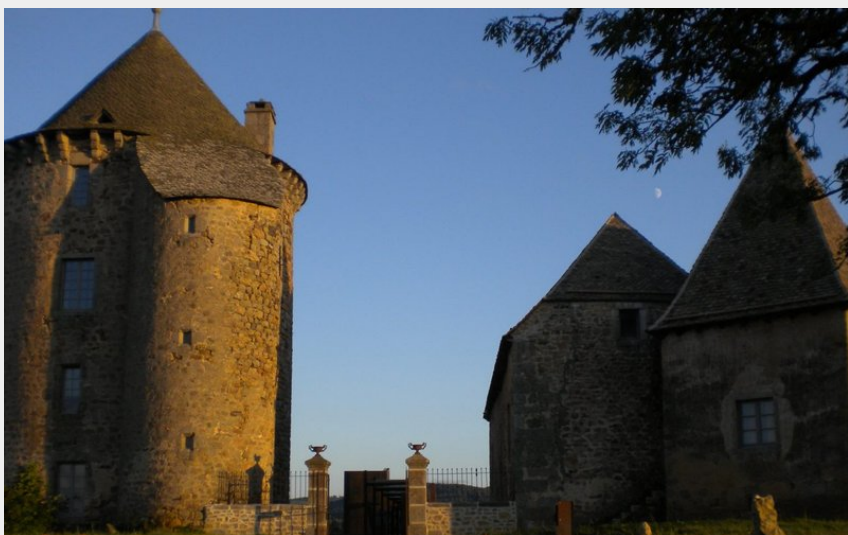
Le château du Couffour au coucher du soleil