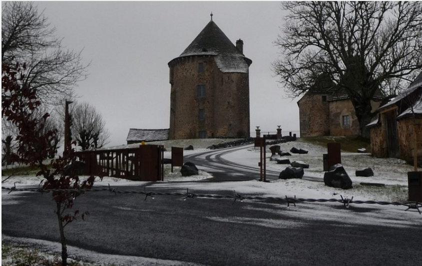
Le château du Couffour habillé de neige