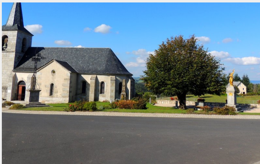
L'église de Fridefont