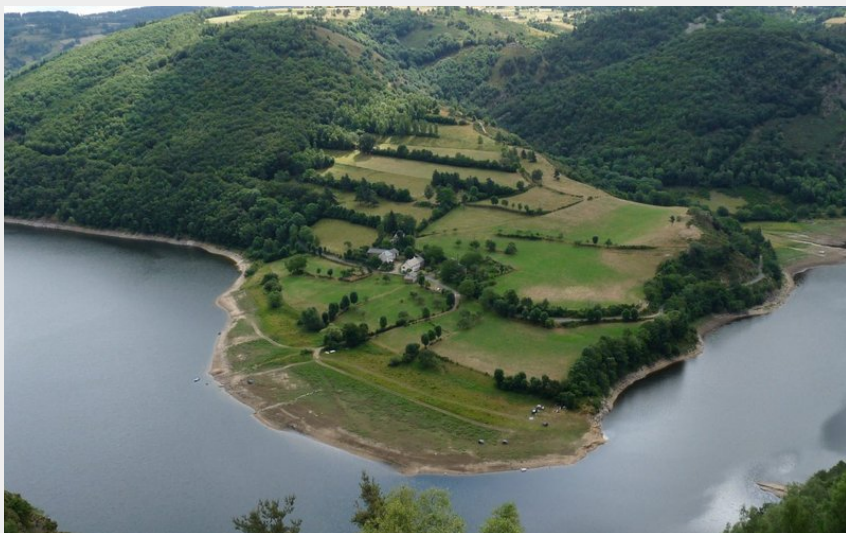
La vallée du Bès avec le village de Laval