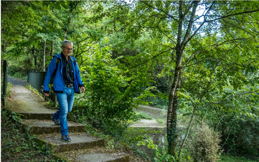
Le ruisseau du Verzolet