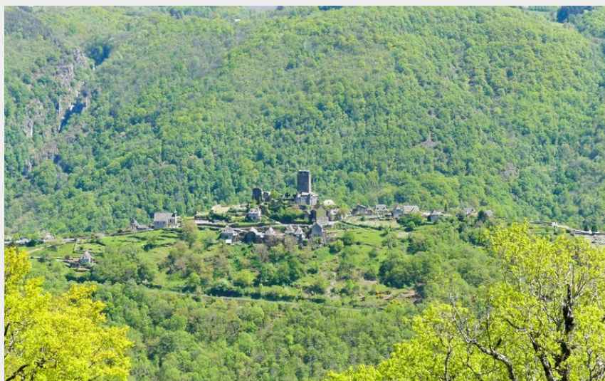
La vue sur Valon depuis Rouens