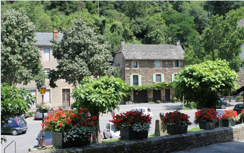
Parking de la Poste (LuciePinot)