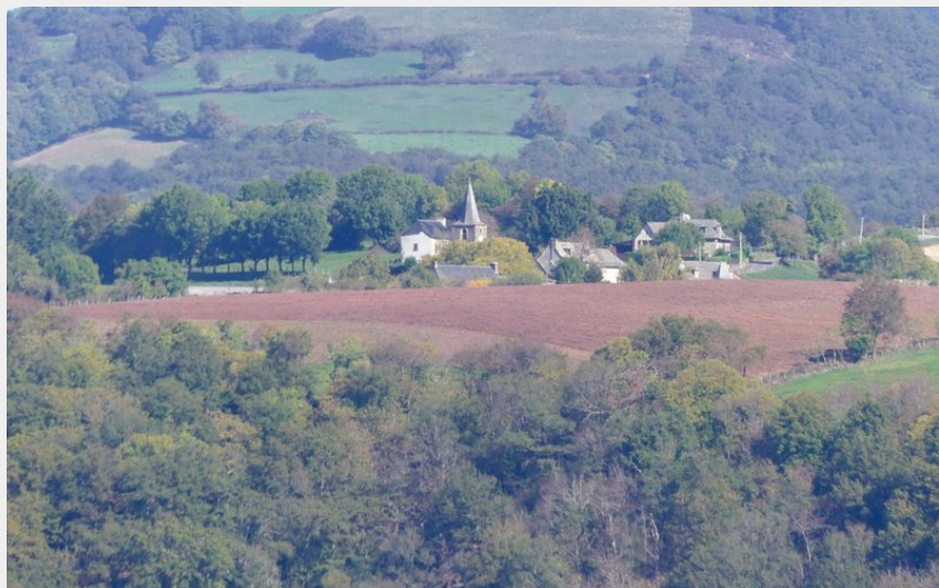
Le village d'Annat