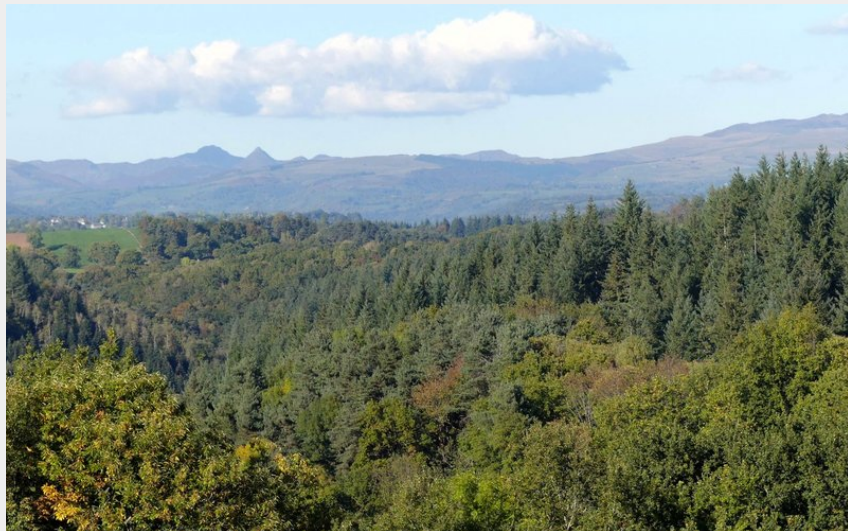
La forêt de Seyrolles et les Monts du Cantal