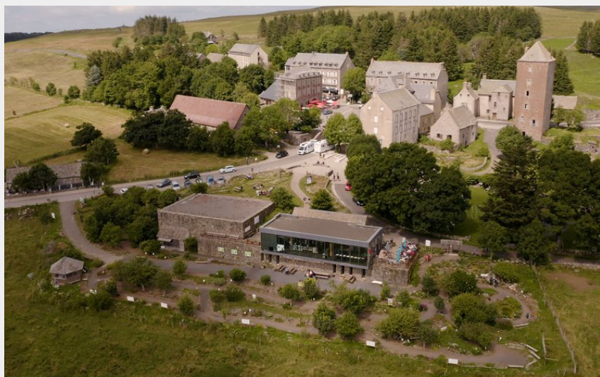
La Maison de l'Aubrac