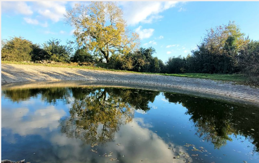
De la vallée du Verzolet au plateau d'Hermelix