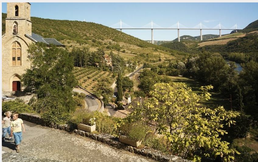
Vue depuis le Village de Peyre