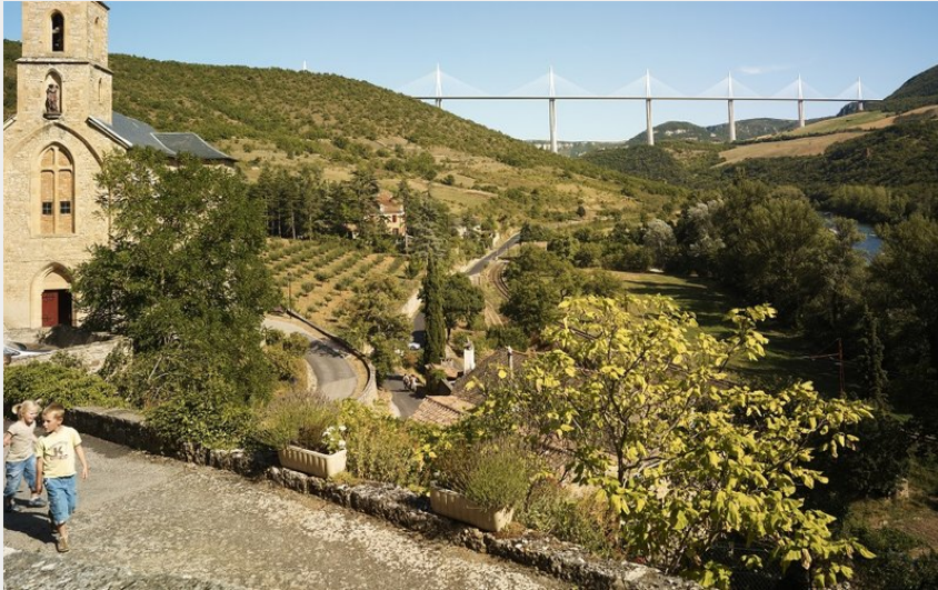
Vue depuis le Village de Peyre