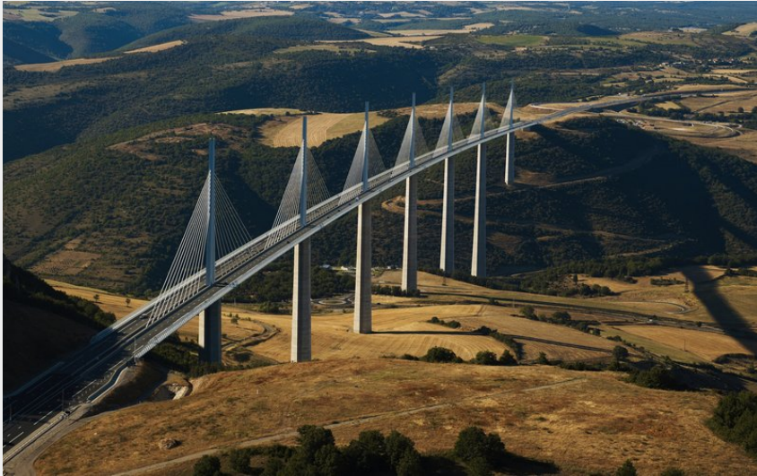
Viaduc de Millau (Grands Sites Midi-Pyrénées)