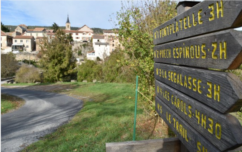
Au départ de Lapanouse