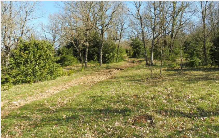
Sur le chemin... (SandrinePerego)