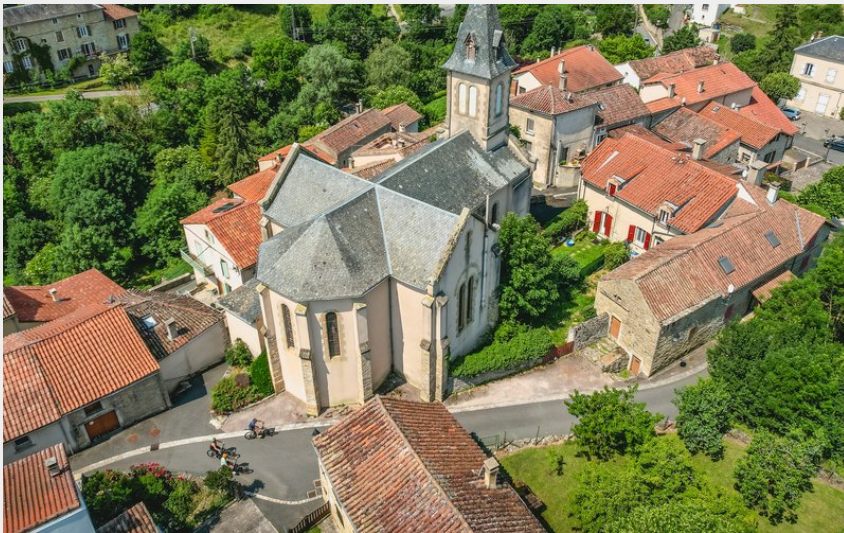
Saint-Jean d'Alcapiès (Roquefort Tourisme)