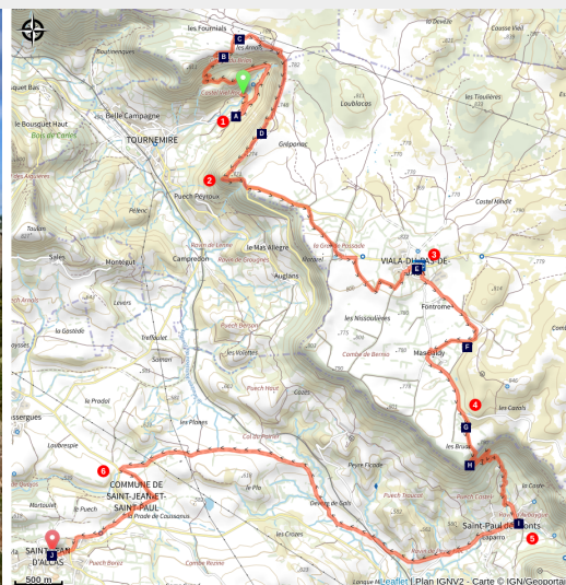
De La Maison de Vigne à St-Jean-d'Alcas (Roquefort Tourisme)

C'est la randonnée des deux cirques : celui de Tournemire et celui de Saint-Paul-des-Fonts, trésors géologiques et paradis de biodiversité. Une entrée inoubliable au pays des Hospitaliers !