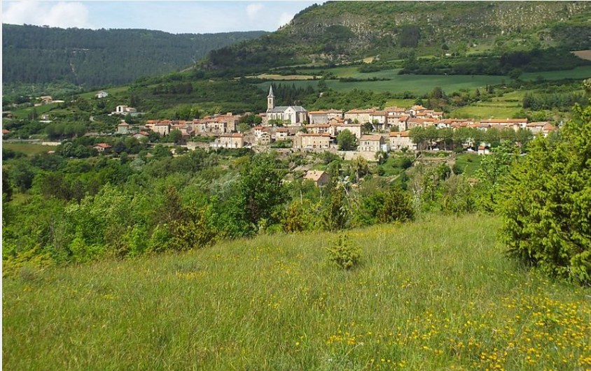
Saint-Félix de Sorgues (Delphine Atché)