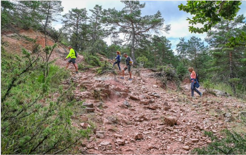
Les terres rouges