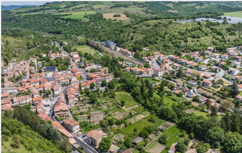
Au loin la Butte de Sargel (Virginie Govignon)