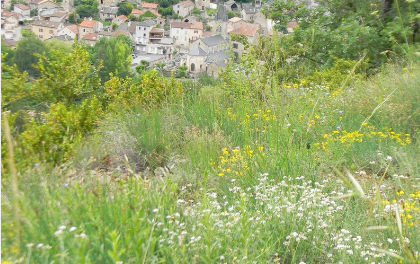
Village de Verrières (DavidBec)