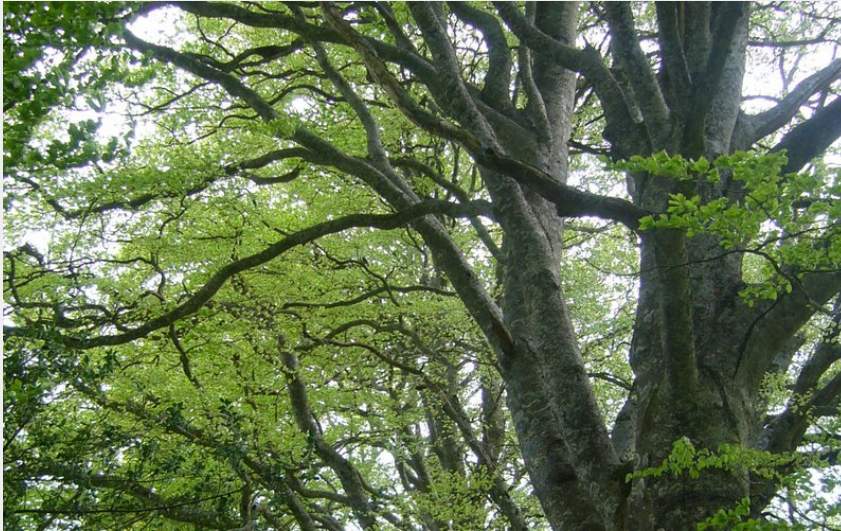
Hêtres centenaires (ChristineRousseau)